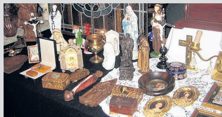
Antiek en curiosa op de beurs in Giesbeek.

Cor Sanne en gastheer Dick van Altena zelf. Klapstoel meenemen. Er zijn eetkraampjes. Za. 27-08, 17.00-21.00 u. € 10. (voorverkoop € 9 via 0481-481661). Info: www.dickvanaltena.com