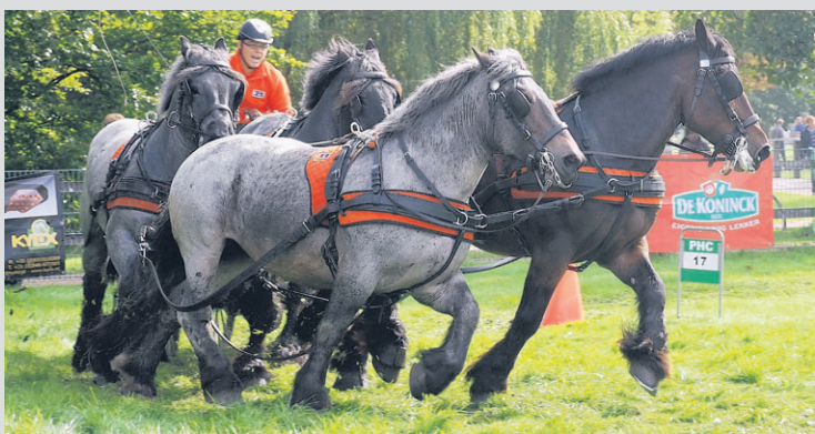
De paarden in de weer tijdens de menwedstrijd.

Tips voor deze rubriek kunt u, minimaal een week voor verschijning, mailen naar: redactie.geniet@gelderlander.nl